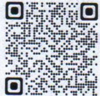
สแกนเพื่อขอคำปรึกษา

สำนักพัฒนาและส่งเสริมธรรมาภิบาล โทรศัพท์ ๐ ๒๕๒๘ ๔๐๓๗ ไปรษณีย์อิเล็กทรอนิกส์ ggde@nacc.go.th